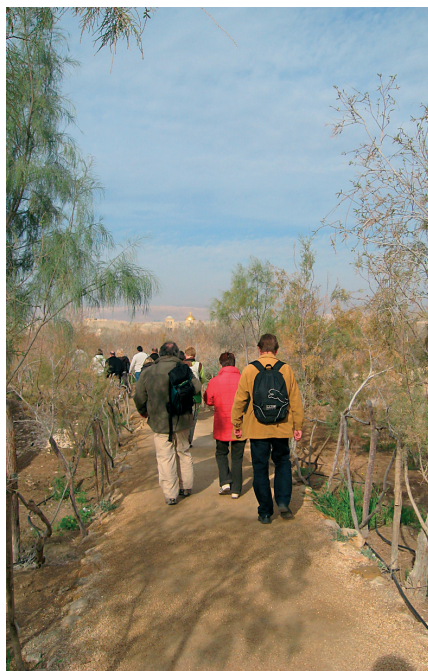
In Betanië loop je langs de oever van de Jordaan onder begeleiding van een gids.

Het eindpunt van het shuttlebustraject is het beginpunt van de wandelroute naar de doopplaats in de rivier de Jordaan. Doorgaans begint de route bij een Grieks-orthodox kerkje met een opvallende rode koepel en het klooster erachter. Pelgrimshuizen liggen hier ook. Het tamariskwoud rondom is de wildernis waar Johannes de Doper als kluizenaar leefde en zich slechts voedde met honing en sprinkhanen. Al snel volgt zicht op een zijstroompje van de Jordaan. Vanachter de bomen is de schitterende gouden koepel van de Grieks-orthodoxe Johannes de Doperkerk zichtbaar. De rest van de