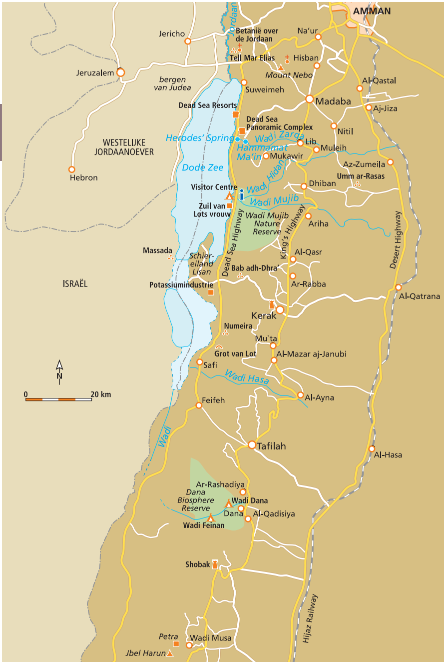
Tussen Amman en Petra: langs de Dode Zee en de King's Highway