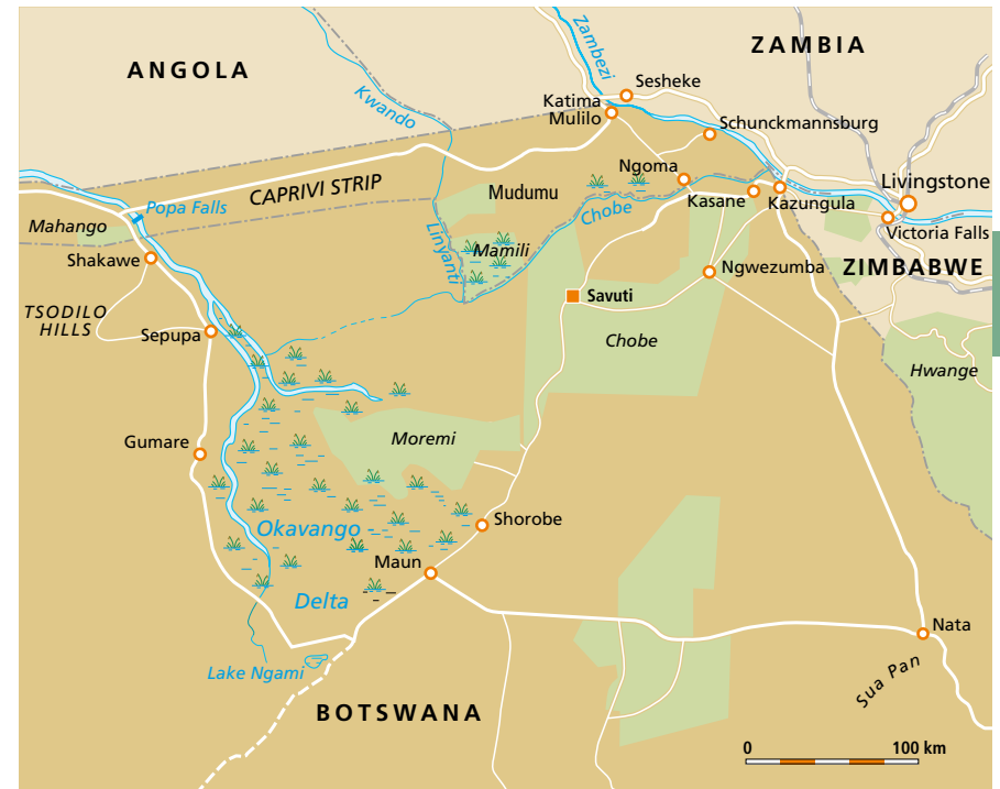
Noord-Botswana en Caprivi Strip

Er zijn slechts een paar plaatsen in centraal zuidelijk Afrika waar de litschi-waterbok ( lechwe ) voorkomt. De belangrijkste daarvan zijn Kafue (Zambia), Chobe en Moremi. Ondanks het feit dat het dier zeldzaam is, worden