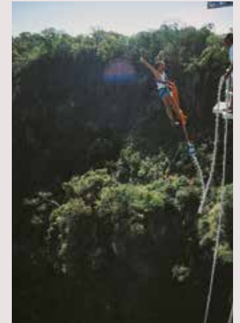
Een sprong om nooit te vergeten.

Sportief en avontuurlijk aangelegde toeristen kunnen zich in Victoria Falls volledig uitleven. Wereldberoemd is het white water rafting op de Zambezi, dat jaarlijks duizenden enthousiaste beoefenaars vanuit de hele wereld trekt. Touroperators als Shearwater, Frontiers en Sobec geven doorlopende videovoorstellingen over dit spektakel, die de lading redelijk goed dekken. De deelnemers worden in de ochtend opgehaald en dalen te voet af in de Zambezikloof. Na uitvoerige instructies gaat men aan boord van de rubbervloten.