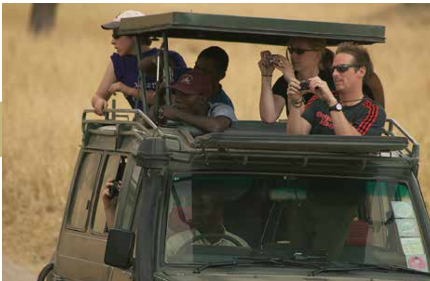
Voor de mooiste safarifoto's is een camera met grote zoomlens een goed idee.