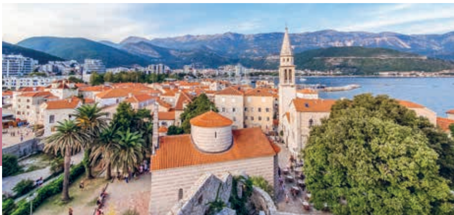
Budva, uitzicht over de oude stad.