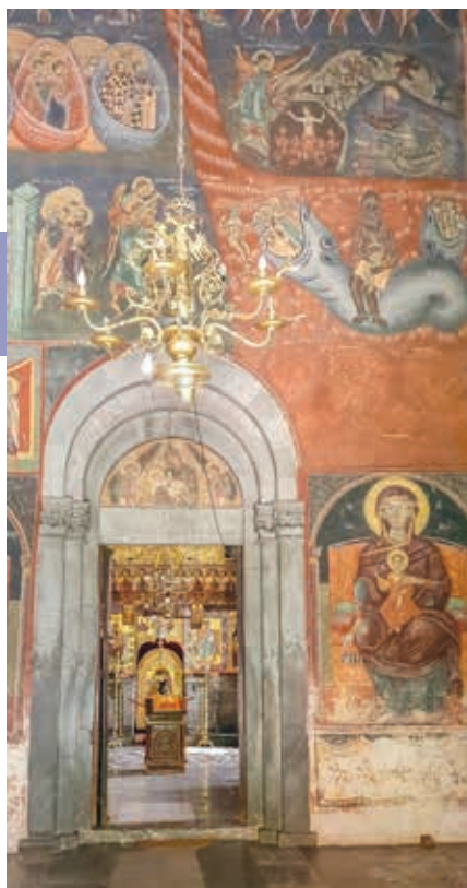
Middeleeuwse fresco's in het Morača-klooster.