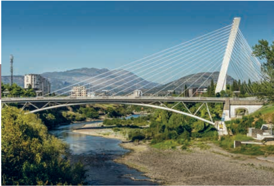
Milleniumbrug in Podgorica.