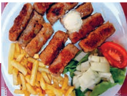
Een bord vol čevapčići.

maïsmeeel met kajmak en eventueel met čvarci (spekjes). Stevig en voedzaam, vooral na een lange wandeling in de bergen.