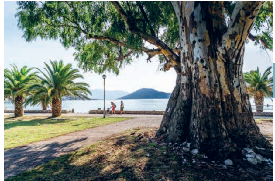
Langs de baai bij Igalo.

Nu kun je vanuit Kroatië gewoon over de Magistrala Montenegro binnenrijden. De eerste plaats van betekenis voorbij de grens is Igalo , gelegen aan het einde van de baai van Herceg Novi (Hercegnovski zalev). Als je er aankomt kan het reusachtige Institut Igalo ook wel Spa Centar Igalo, rechts van de weg, je niet ontgaan. In het vroegere Joegoslavië hadden de therapeutische en geneeskrachtige behandelingen in dit kuuroord een naam hoog te houden. Het complex is sinds die tijden nauwelijks opgeknapt en ziet er nog steeds strak-socialistisch uit. De kamers kunnen wel wat modernisering gebruiken, maar de medische behandelingen zijn er nog steeds erg goed, bijvoorbeeld met de befaamde geneeskrachtige modder uit de baai ('Igaljsko blato') en het minerale bronwater uit de heuvels ('Igaljske slatine'). Er komen daarom ook redelijk wat mensen uit Nederland en België voor een kortere of langere kuur naar Igalo ( www.igalospa.com ).