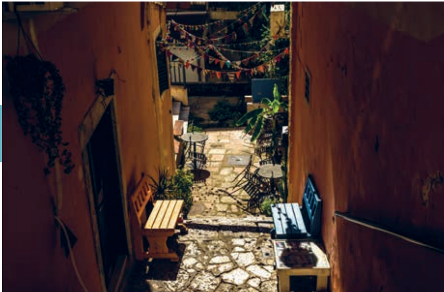
Straatje in de oude stad van Herceg Novi.

het gebied in bezit; zij werden in de 3de eeuw v.Chr. onder bestuur van het Romeinse Rijk gebracht. Na de val van eerst het Romeinse en daarna het West-Romeinse Rijk kwam de regio in Byzantijnse invloedssfeer. In de vroege middeleeuwen arriveerden Slavische stammen en ontstonden er enkele vorstendommen langs de oostelijke Adriatische kust. Een ervan was Travunia, dat het westelijk deel van de Baai van Kotor, de bergen erachter en de huidige Kroatische regio Konavle omvatte en was verbonden met het middeleeuwse koninkrijk Servië. In de 14de eeuw ging het gebied over naar het toenmalige Bosnische koninkrijk. Hoewel er al eeuwen mensen woonden, stichtte de Bosnische koning in 1382 de stad Herceg Novi officieel, door er stadsrechten aan te geven en met de bouw van fortificaties te beginnen. Hij noemde de plaats in eerste instantie trouwens Sveti Stefan. De eeuw erna kwamen stad en omgeving als erfoed in handen van de Bosnische hertog Stjepan Vukčić, die de naam veranderde in Herceg Novi, 'Nieuw Hertogdom'. Buiten de Balkan kwam Herceg Novi echter bekend te staan als Castelnuovo, de naam die de Venetianen eraan gaven.