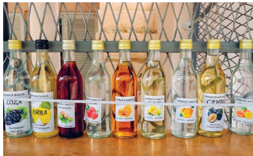
Brandewijn in allerlei soorten en smaken.

Zoals ook elders op de Balkan wordt er niet alleen wijn gedronken in Montenegro. Een stevige borrel gaat er bij veel Montenegrijnen wel in, bijvoorbeeld de brandewijn rakija. De druivenbrandewijn loza of lozovaca gaat veel over de toonbank, maar het spul wordt ook met allerlei andere dingen gestookt, bijvoorbeeld kruiden, perziken, blauwe bessen, walnoten of pruimen. In het laatste geval hebben we het over šljivovica, de befaamde prui-