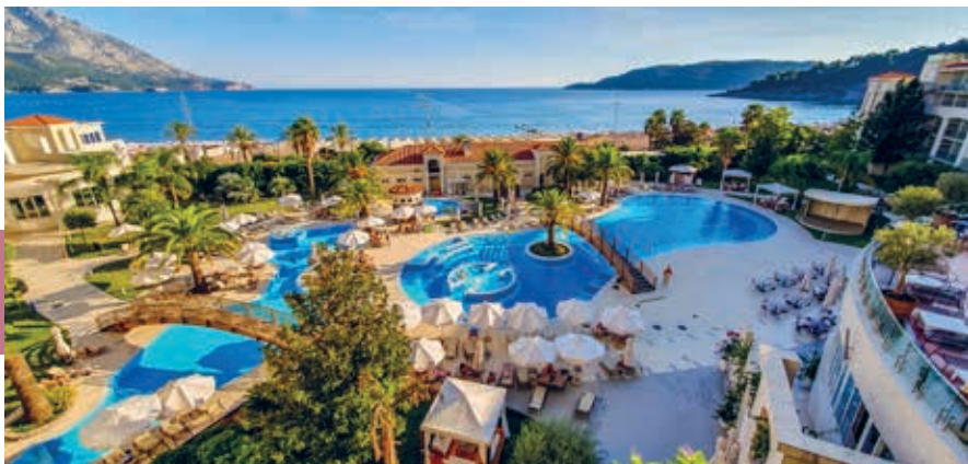
Hotelcomplex bij Plaža Bečići.

Ten noorden van de oude stad liggen de jachthaven van Budva, geliefd bij rijke Russen en Oekraïners, en het kleine Plaža Pizana, met beachclub en uitzicht op het eiland Ostrvo Sveti Nikola , het grootste eiland van Montenegro. Het is onbewoond en ongeveer 2 km lang, maar er zijn wel wat kiezelstrandjes en een paar horecagelegenheden. 's Zomers gaan er taxibootjes heen en weer naar het eiland. Zo'n 300 m ten westen van de oude stad is het goed zonnebaden op Mogren Plaža , een erg fraai gelegen tweedelig strand onder aan steile klifwanden. In het hoogseizoen is het er soms zo druk dat het wel op een pinguïnkolonie lijkt. Iets meer kans op wat ligruimte heb je dan op Slovenska Plaža , het 1,6 km lange strand dat helemaal langs de baai van Budva loopt. De boulevard langs het strand, Slovenska Obala, is in het hoogseizoen druk en gezellig. Er staan souvenirstalletjes, aanbieders van toeristische tochtjes, visverkopers, verhuurders van strandstoelen en zo meer, terwijl de bars, cafés, ijssalons en restaurants er goede zaken doen. In het achterland bevinden zich vooral hotels, appartementencomplexen, winkelcentra en andere voorzieningen.