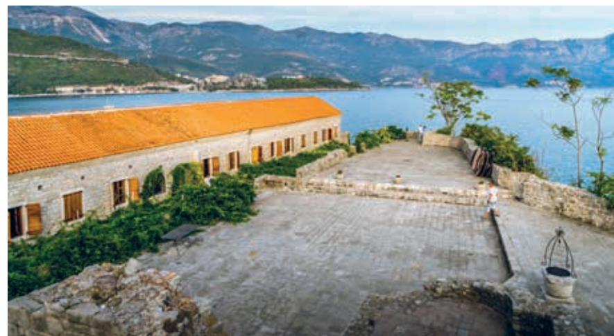
Op de citadel van Budva.

Achter de hoofdboort in de Venetiaanse vestingmuren loopt de belangrijkste straat van Stari Grad, de Njegoševa . Verwacht geen brede winkelstraat of verkeersader, want de oude stad is autovrij en bestaat louter uit smalle en schilderachtige straatjes met hier en daar een pittoresk pleintje, allemaal piekfijn gerestaureerd na de aardbeving van ruim 40 jaar geleden. Er zijn veel leuke kleine winkeltjes en restaurantjes en een paar oude kerken. De