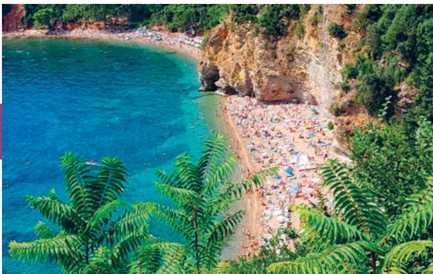
Budva, Mogren Plaža.