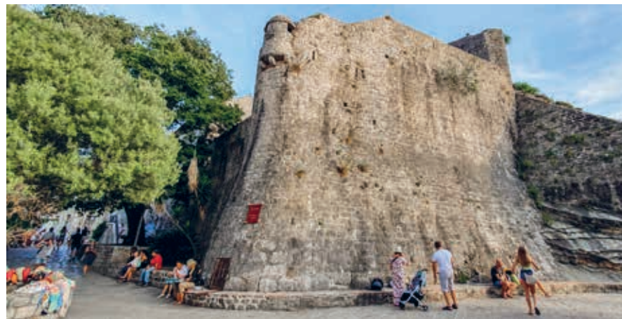
De stevige stadsmuren van Budva hielden ongewenste bezoekers buiten de deur.

staan. Vervolgens liep de historie parallel met die van de rest van Montenegro: onderdeel van het Joegoslavische koninkrijk, bezetting door de Asmogendheden in de Tweede Wereldoorlog en daarna deel van het naoorlogse Joegoslavië, tot aan de Montenegrijnse onafhankelijkheid in 2006.