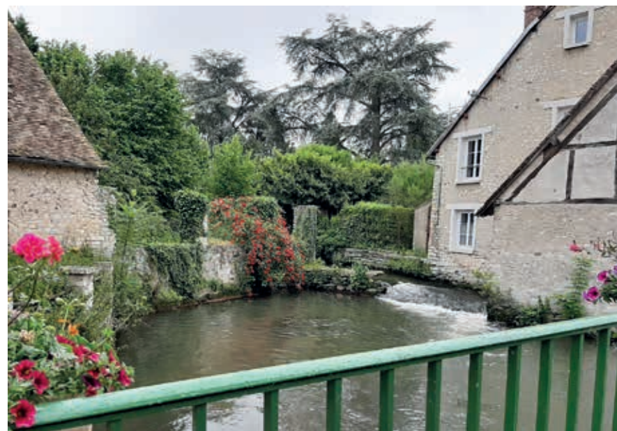
Langs de Eure.

Het noordelijkste departement is Seine-Maritime, gevormd door het Pays de Bray in het oosten en het Pays de Caux aan de kust. Het Pays de Bray is een lieflijk landbouw- en veeteeltgebied met boomgaarden en grote bossen. Het Pays de Caux is een uitgestrekt kalkplateau, dat aan de zee kant begrensd wordt door de beroemde steile rotsen en aan de andere zijde door de Seinevallei. De voornaamste landbouwproducten hier zijn granen, vlas en suikerbieten. De kust, de Côte d'Albâtre, begint bij het schilderachtige badplaatsje Le Tréport en loopt via Dieppe, Fécamp en Étretat tot aan Le Havre. De zuidgrens wordt gevormd door de Seine, die in Bourgondië ontspringt en 776 km verderop in het Kanaal uitkomt. De Seinevallei – waarvan het oostelijke deel in het departement Eure ligt – is met zijn mooie landschap en historische monumenten een aantrekkelijke toeristische bestemming. Centraal in de Seinevallei ligt Rouen, de hoofdstad van Normandië. Deze museumstad heeft een prachtig gerestaureerde oude binnenstad en trekt jaarlijks enorme aantallen bezoekers. De kathedraal, andere kerken en het justitiële paleis zijn hoogtepunten van gotische bouwkunst. Bijzondere middeleeuwse straten met vakwerkhuisen, de populaire poort-toren Gros-Horloge en een reeks