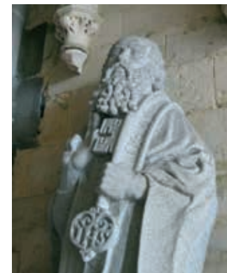
Petrus met de sleutel.

Het duurde tot in de 14de en 15de eeuw voordat er uitgesproken gotische kerken werden gebouwd. Deze konden overigens niet concurreren met hun voorbeelden in Normandië of Île-de-France, noch qua afmetingen noch qua ornamentiek. De stadjes die de kathedralen lieten bouwen – Dol, Saint-Pol-de-Léon, Tréguier, Quimper – waren niet zo kapitaalkrchtig. Ook had het harde en moeilijk te bewerken graniet, dat veel gebruikt werd, invloed op de constructie. Men moest zich tevreden stellen met vrij lage gewelven en een beperkte decoratie. Chronisch geldgebrek was er de oorzaak van dat de bouw soms drie tot vijf eeuwen duurde, zodat alle fasen van de gotiek in één gebouw zijn terug te vinden: vanaf de sobere bogen uit de begintijd tot en met de ontsparingen van het flamboyante. Hier en daar komt zelfs de renaissance al tevoorschijn.