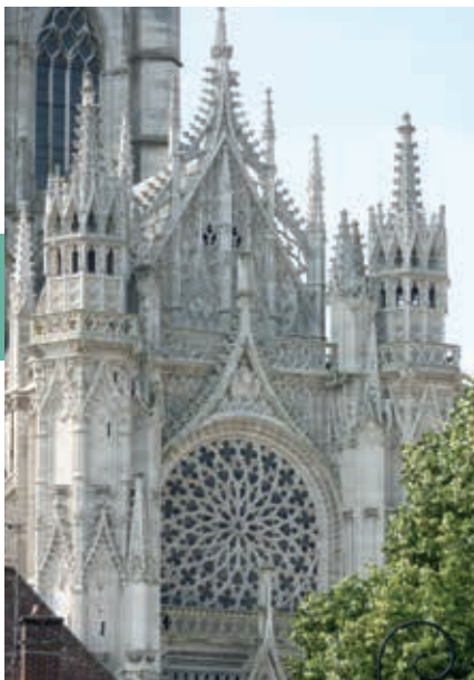
Flamboyante gotiek van de kathedraal van Évreux.

In Anet herinnert een groot kasteel aan Diane de Poitiers, bij velen bekend door het prachtige, voor haar gebouwde kasteel van Chenonceaux. Oude prenten tonen aan dat in Anet ooit een klein Versailles lag, gebouwd in renaissancestijl door Philibert Delorme en verfraaid op z'n Italiaans door beroemde kunstenaars als de beeldhouwers Jean Goujon en Germain Pilon, de Italiaanse emalleur Benvenuto Cellini en tapijtwevers uit Fontainebleau. Diane de Poitiers woonde er en ligt er begraven. Meer dan de helft van de gebouwen verdween in de loop van de tijd, maar er is nog steeds genoeg te zien: het toegangsportaal, de linkervleugel van de vroegere cour d'honneur met de kamer van Diane, tapijten, een grote staatsietrap enzovoort. De kapel stamt uit 1548. Op de Place du Château, links van de ingang,