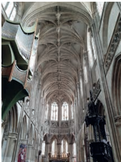
Links de kathedraal van Coutances, rechts de kerk Saint Pierre in Caen.

basiliek aan, met dien verstande dat het koor een bijzonder grote betekenis kreeg: het is soms bijna even lang als het schip zelf, met een straal van kapellen eromheen. De plaats van de toren en het aantal torens varieerden.