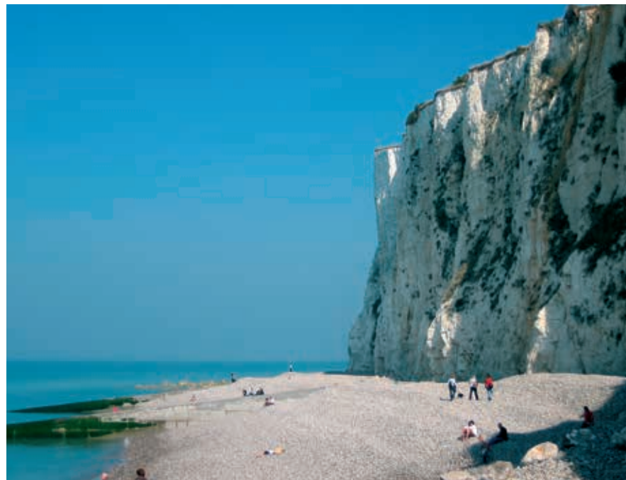
De Côte d'Albâtre bij Le Tréport.

Vlak bij de Place Carnot staat de Chapelle du Collège – van het jezuïetencollege – uit 1620, met een gevel van baksteen en beeldhouwwerk. Het meest de moeite waard zijn de zwartmarmere, met goud ingelegde graftomben van Hendrik van Lotharingen en zijn gemalin Catharina van Kleef.