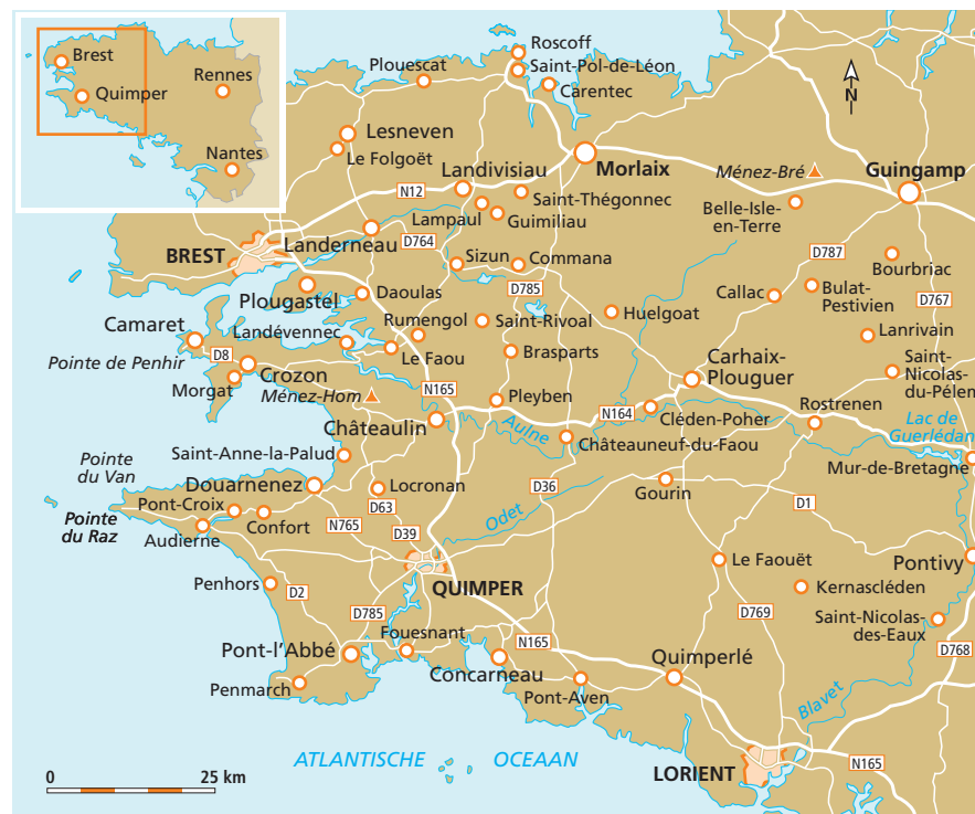
West- en Midden-Bretagne

Het 16de-eeuwse kerkje van het dorp Le Faou staat op de hoge rivieroever, vooral bij hoogwater heb je er vanaf de overkant een mooi zicht op. Aan