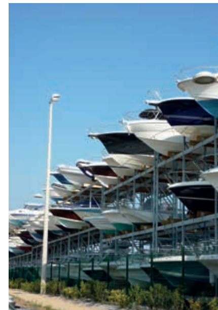
Port du Crouesty: parkeergarages zijn niet aan auto's voorbehouden...

De kloosterkerk , oorspronkelijk gebouwd in de 11de eeuw, dateert in haar huidige vorm grotendeels uit de 16de–17de eeuw. De linkerkant van het romaanse koor is met modillons versierd: een kleine sculptuur stelt een toerenoiscène voor. Binnen staat in ditzelfde mooie romaanse koor een barok altaar met erachter het graf van de heilige Gildas. Verder vallen enkele grafstenen op en twee mooie kapitelen die als wijwatervat gebruikt worden. Er is een rijke schatkamer (trésor).