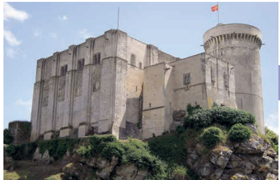
Het kasteel van Falaise.

Langs muren met schietgaten en halfronde torens wandel je omhoog naar de kasteelpoort. Je komt dan op een groot plein met grasvelden en brokstukken van muren. Er is alles aan gedaan om van een bezoek een aantrekkelijke en spannende belevenis te maken en met succes. Je kunt een parcours lopen, buitenom, waarbij op verschillende plaatsen allerlei aspecten op spectacu-