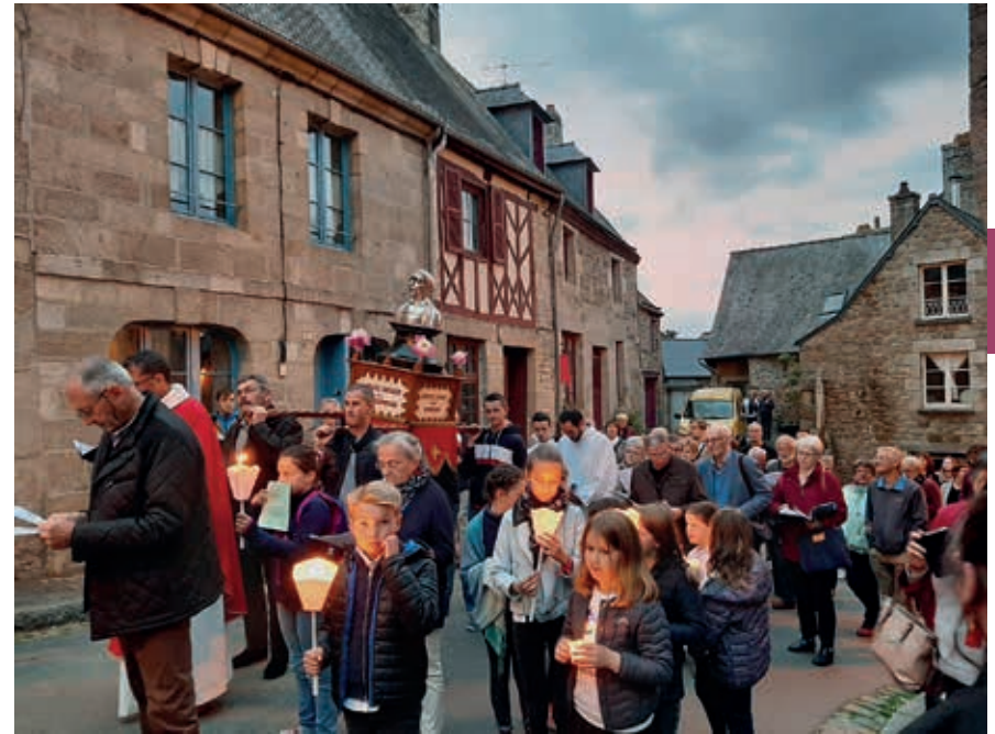
Pardon in Moncontour.

Patrones van de hooioogst is sinds jaar en dag de heilige Anna, moeder van Maria. Haar cultus werd in het verleden verbreid tijdens de kruistochten en in Bretagne vooral gepropageerd door hertogin Anne de Bretagne, de latere koningin. Zij is nu de patroonheilige van Bretagne. De beroemdste pardon van heel Bretagne is die van Sainte-Anne-d'Auray, geheel te harer ere, net als die van Sainte-Anne-la-Palud. Een gezegde in Bretagne luidt: 'Dood of levend, eens moet iedere Breton naar Sint-Anna.'