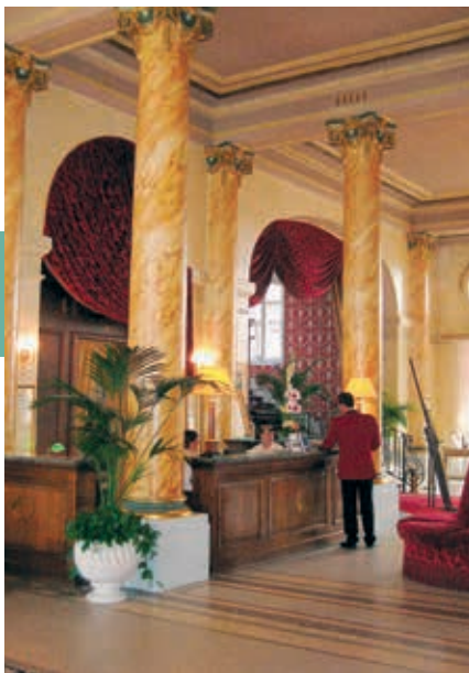
Het Grand Hôtel in Cabourg, waar Proust logeerde.

de zomermaanden trekken liefhebbers uit binnen- en buitenland.