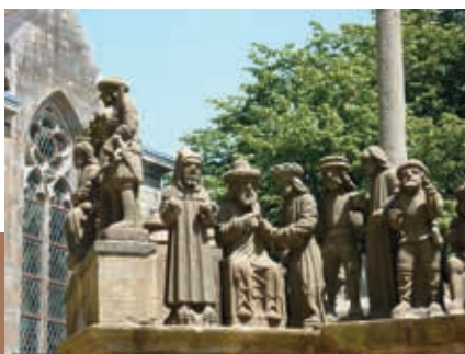
De calvaire in Plougastel-Daoulas.

reik je Le Faou, het beginpunt van de weg over het schiereiland.