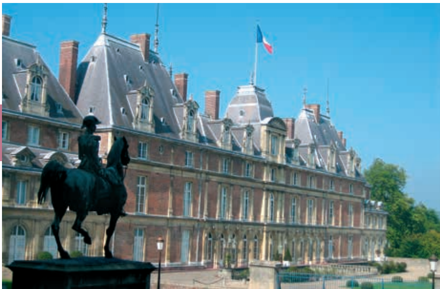
Het kasteel van Eu.