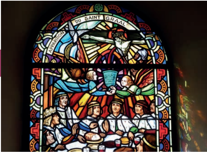
De ridders van de Ronde Tafel op zoek naar de heilige Graal, in de kerk van Tréhorentec.