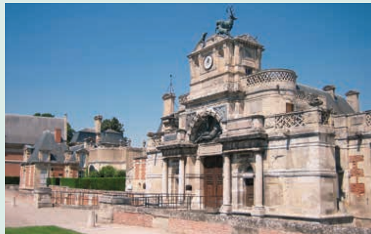
Kasteel van Diane in Anet.

> MUSÉE D'ART ET D'HISTOIRE MARCEL-DESSAI , www.ot-dreux.fr .