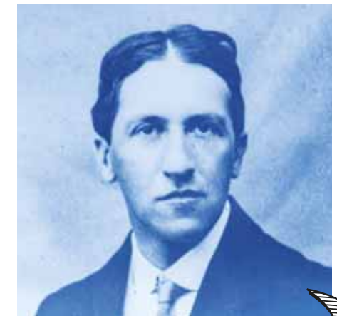
Foto van Piet als jonge man