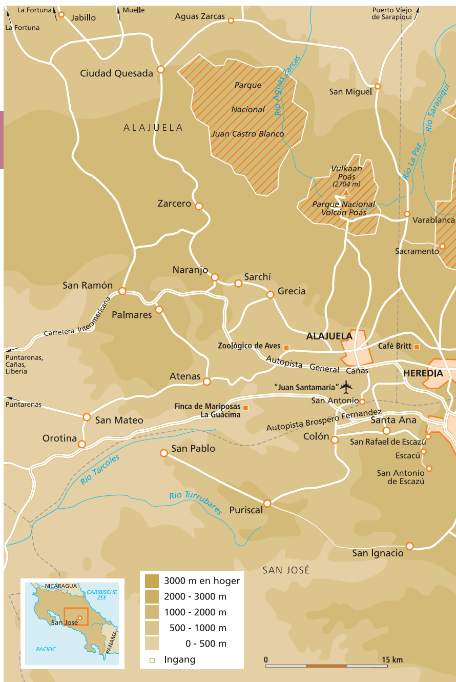
Valle Central: de omgeving van San Jos 