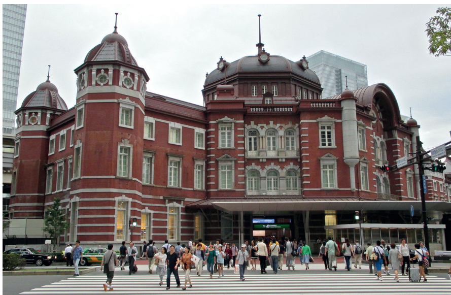
Tokyo Station: de koepel van de noordelijke Marunouchi-ingang.