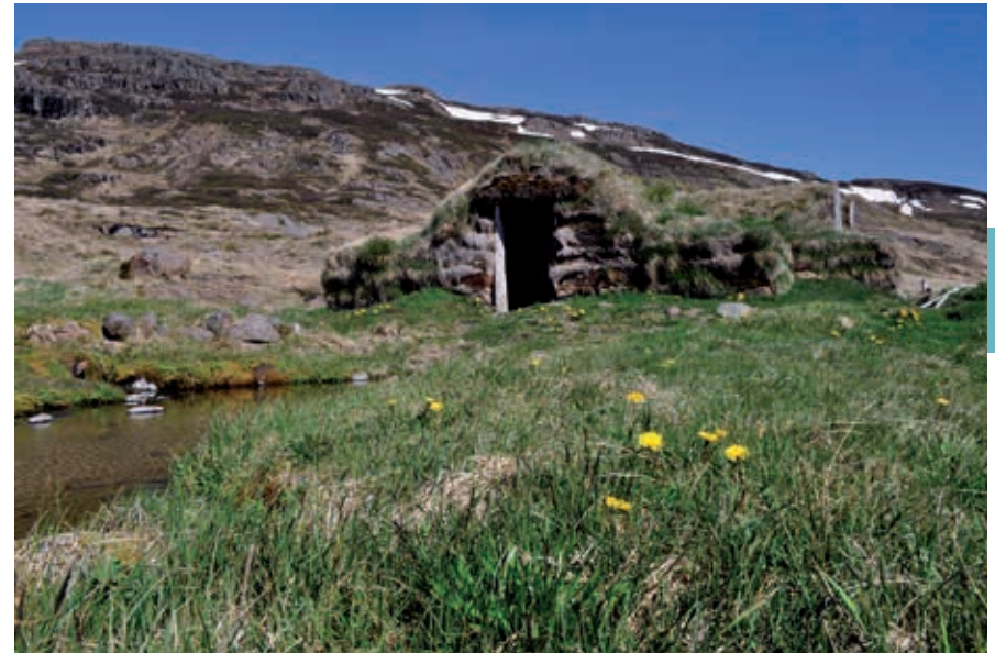
Turfhut in Bjarnarfjörður.

In het Þjórsárdalur zijn verschillende van deze vroegmiddeleeuwse boerderijen opgegraven. Ze werden in 1104 door een uitbarsting van de Hekla totaal verwoest. De bekendste is Stöng. In Keldur bevindt zich een goed geconserveerde middeleeuwse boerderij, waarvan de skáli waarschijnlijk uit de tweede helft van de 12de eeuw stamt. De andere vertrekken zijn er