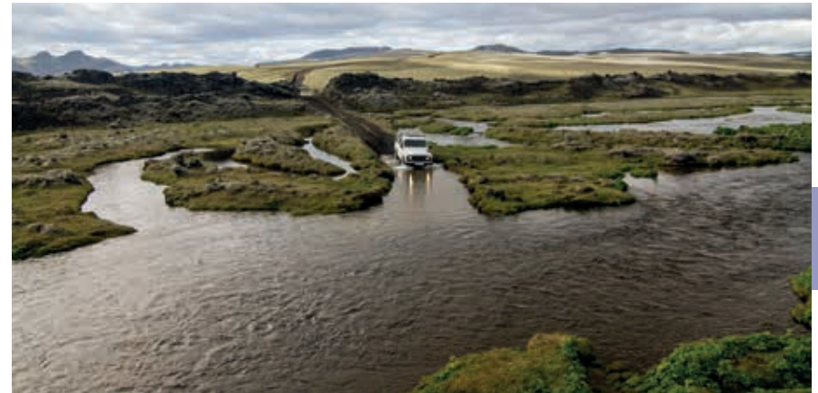
In het binnenland zijn de meeste rivieren niet overbrugd.

De Kjölur staat niet op iedere kaart als F-weg aangegeven en is officieel dan ook voor niet-4WD auto's toegankelijk. De realiteit leert dat de weg ongegeschikt is voor kleinere (huur)auto's. Hoewel de meeste rivieren overbrugd zijn, is de onverharde Kjölur meestal in slechte staat. Let op: een tweewiel aangedreven auto is op de F-wegen (en de Kjölur) niet verzekerd (zie over-