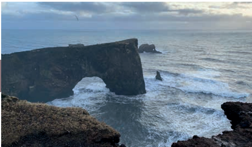
Dyrhólaey, deze natuurlijke stenen brug is meer dan 100 m hoog.

zwavel stinkt als gevolg van vulkanische activiteit onder het ijs van de Mýrdalsjökull.