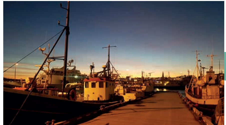
Winterochtend in Reykjavik.

> HALLGRÍMSKERK. www.hallgrimskirkja.is.