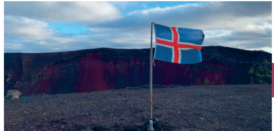
IJslandse vlag bij Ljótipollur.

IJsland werkt hard aan de gelijkheid tussen man en vrouw. Op de World Global Gender Gap List prijkt IJsland al 7 jaar bovenaan. Bijna 80% van alle IJslandse vrouwen werkt voltijds en met een in 2016 aangenomen wet worden werkgevers gedwongen om gelijke salarissen voor gelijk werk te betalen. Na een kort geding dat een vrouwelijke werknemer aanspande tegen haar werkgever wegens ongelijkheid van haar salaris ten opzichte van een