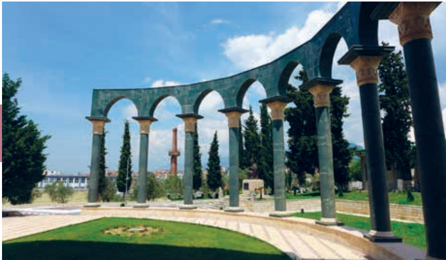
Het Bektashi World Center in de heuvels aan de oostkant van Tirana.

verdreven naar andere min of meer beschutte delen van de stad. Het gebied waar het treinstation heeft gestaan, is nu een brede boulevard.