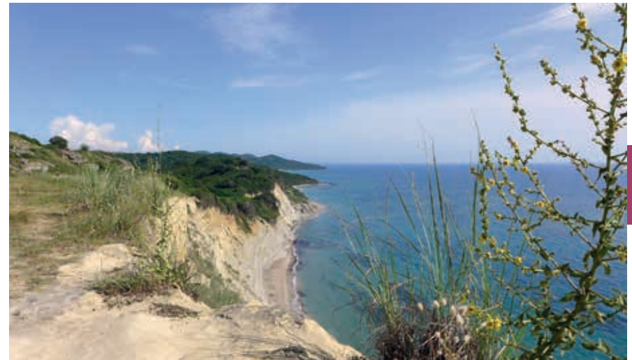
Klif bij de Kaap van Rodon, waar oeverzwaluwen hun nesten maken.

Gemiddeld ligt Albanië 708 m boven de zeespiegel. De hoogste piek is die van de Korabi, op 2751 m, niet ver van de Noord-Macedonische grens vlak bij Peshkopi. De heuvels en bergen zijn grillig, steil soms, gespleten, gescheurd en hier en daar zo goed als ontoegankelijk. Afrikaanse en de Euraziatische tektonische platen (stukken aardkorst) botsten hier tussen