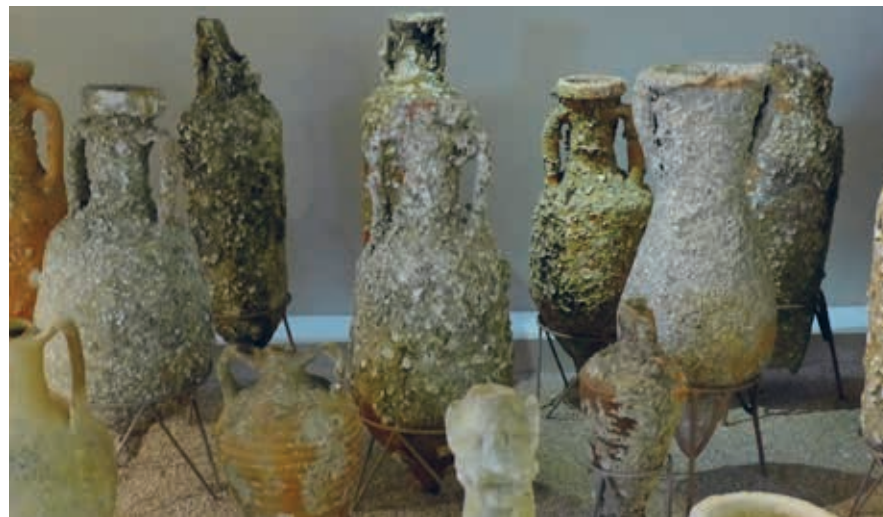
In zee gevonden amforen uit de Romeinse tijd in het Archeologisch Museum van Durrës.

Langs de promenade van de Rruga Gurrila kun je nog een heel stuk doorlopen langs de kust, die hier stiller en schoner is dan ten zuiden van het centrum. Je vindt ook hier een hoop restaurants, cafés en bars. Iets verder landinwaarts ligt de SH51, ofwel de Rruga Aleksander Goga, die doorloopt