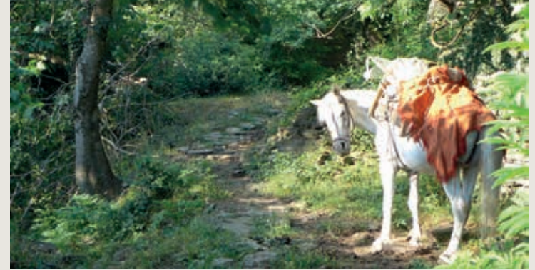
Het nieuwe paard van Ali Kali?

Vanaf de toegang tot het park loopt een honderden meters lang plankier over het drassige land naar het informatiepunt, waar ook een uitkijktoren staat.