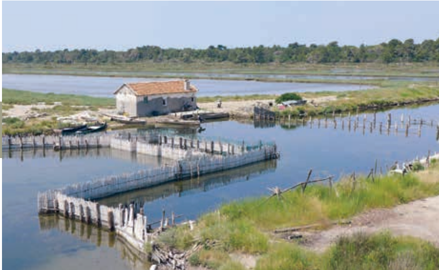
Visvangconstructie in de verbindingsstroom tussen meer en zee.