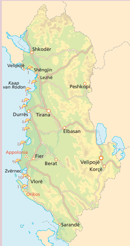
De stilste stranden