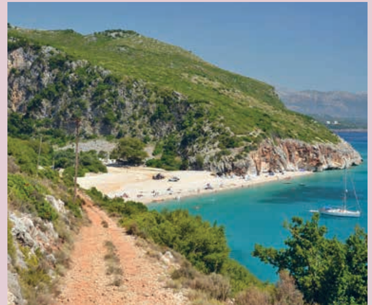
Het strand van Gjipë.

De rustigste stranden aan de Albanese Riviëra waren (in 2020) Gjipë en Jalë bij Vuno, Potam bij Himarë, Borsh, Bunec bij Piqueras, Lukovë, Coco bij Sarandë, Pema e Thatë bij Ksamil en Mango bij Butrint. In de regel geldt: hoe moeilijker het is om er te komen, hoe groter je kans op de perfecte strandidylle. Informeer zo mogelijk van tevoren of de weg te doen is.