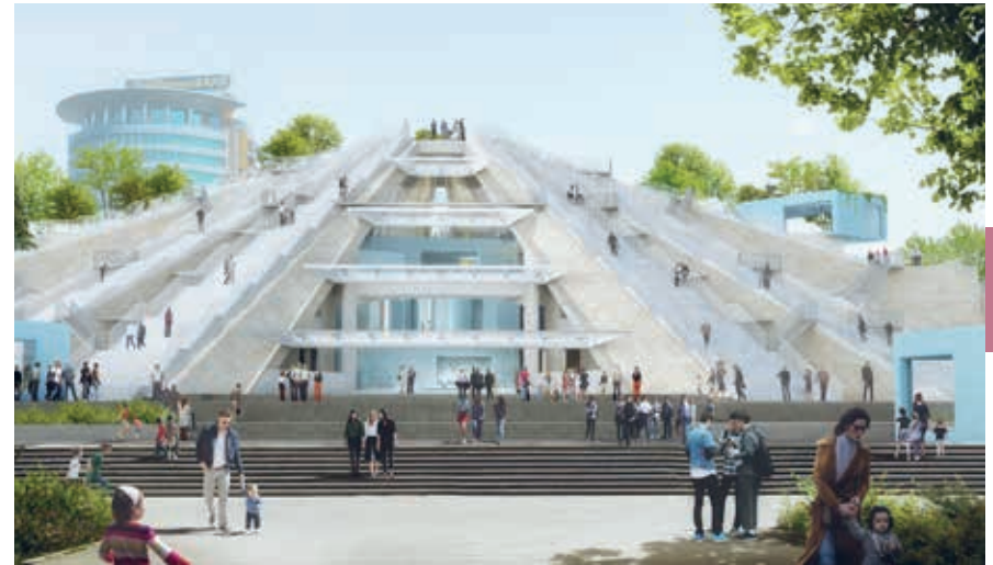
Artist impression van MVRDV van de toekomstige piramide.

Het is een verrassing na de toegangspoort aan de rand van het wat armoe-dige wijkje de immense met pilaren omzoomde koepel van het centrum te zien liggen. Dit is de plek waar bektashi-geestelijken samenkomen om te mediteren. De toegangspoort is elke dag open tot zeven uur, maar het is onduidelijk wanneer je de koepel en het museum dat in de kelder gehuisvest is, kunt bezoeken. Vrij toegankelijk zijn drie kleine tekkes, waar houten tombes staan van gestorven baba's, de spirituele leiders. De tekkes zijn ontworpen met twee halve koepels op ongelijke hoogte, waardoor het licht dat naar binnen komt de vorm heeft van een oog. De muren zijn versierd met motieven en teksten in zeer heldere, mooie kleuren. In een ouder deel van het complex bevinden zich de gebouwen waar de derwisjen verblijven.