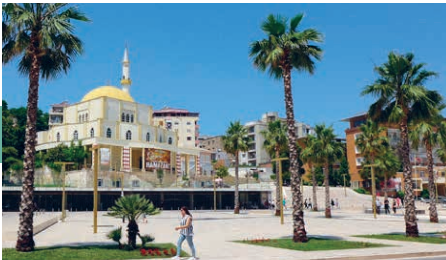
Het centrale plein van Durrës met de Grote Moskee.