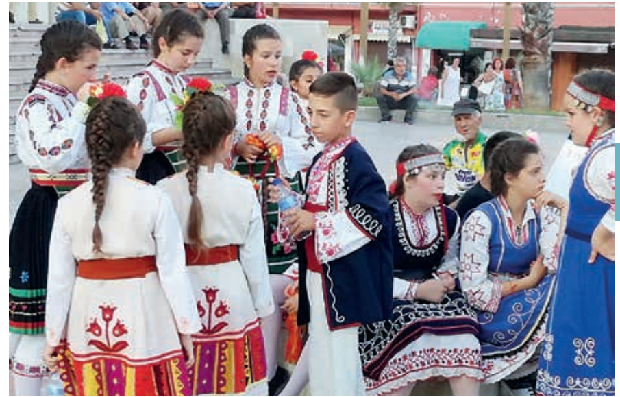
Jonge dansers tijdens een festival voor traditionele muziek en dans in Durrës.