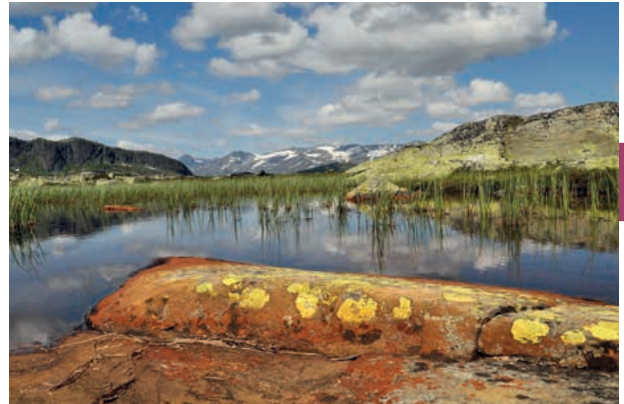
Kenmerkend voor de Noorse natuur: rust, ruimte en weidse uitzichten.

Noren zijn van oudsher vertrouwd met de jacht en de visserij; het zit hun nog steeds in het bloed. Aan de andere kant zijn de Noren natuurbeschermers bij uitstek. In brede lagen van de bevolking en bij de overheden is er grote aandacht voor het milieu en de natuur. De overheid zorgt voor steeds meer natuurreservaten en nationale parken. En de burger houdt zijn omgeving schoon: wie de bergen in gaat, neemt een plastic zak mee voor het afval; zelfs de verteerbare schillen en het klokhuis van de appel gaan mee terug.