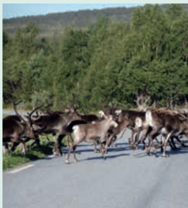
Soms zijn rendieren wel heel nadrukkelijk aanwezig, zoals hier op de weg richting Røros.