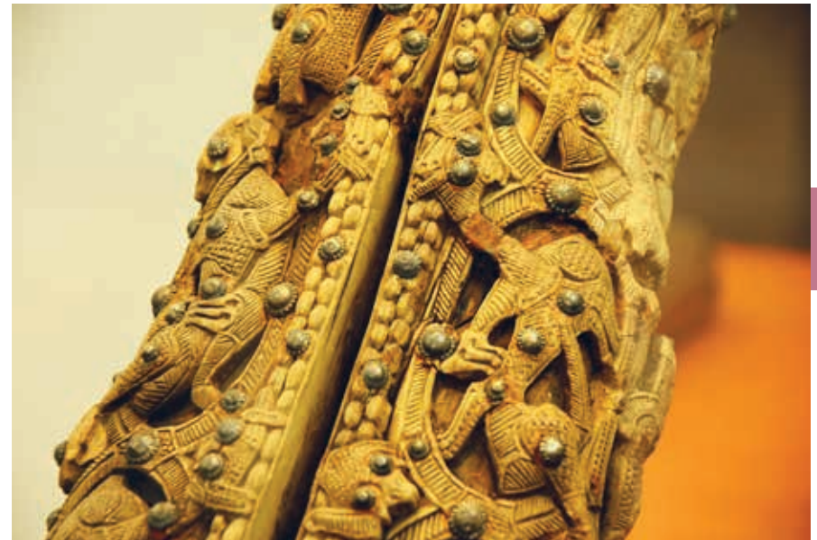
De Vikingen maakten veel werk van het versieren van hun schepen; ze zijn van nabij de bekijken in het Vikingskipmuseum in Oslo.

Niet ver van dit museum ligt Vikingskiphuset. Hier zie je hoe ingenieus de Vikingen de schepen bouwden waarmee ze de wereldzeeën en fjorden bevoeren. Iets verder, maar goed te belopen, liggen de musea die te maken hebben met de historie van de beroemde ontdekkingsreizigers: het Kon-Tiki Museum, Frammuseet en het Norsk Sjøfartsmuseum. Je maakt er kennis met en proeft vooral de sfeer van de inspanningen van de grote mannen