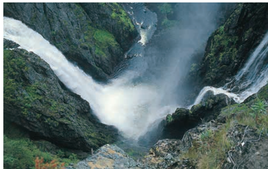
Vøringfossen, een waterval bij Fossli Turistsenter met een valhoogte van 182 m.

De rendieren leven in de zomer vooral van grassen en in de winter van mos. De tamme rendieren worden in strenge winters vaak bijgevoerd als ze op één plaats verblijven. Dit heeft ook te maken met het feit dat sommige Sami niet meer trekken met hun kuddes. In Noorwegen wordt veel wetenschappelijk onderzoek gedaan naar het leven van rendieren. Rendieren zijn bijzonder goed bestand tegen het harde klimaat. Opvallend is dat zowel de mannetjes als de vrouwtjes een gewei kunnen dragen; wel is dat van het mannelijk dier veel forser. Om ook in de winter aan voldoende voedsel te komen hebben de dieren scherpe hoeven, waarmee ze het voedsel onder een dikke sneeuwlaag weg kunnen halen. In het wild komen de los levende mannetjes in de herfst terug naar bestaande kuddes van jongere dieren en vrouwtjes. In april en mei worden de jonge kalfjes geboren. In hun zoektocht naar voedsel kunnen de dieren grote afstanden afleggen. Rendieren hebben een minder goed gehoor dan zicht. Wanneer er rendieren langs de kant van de weg lopen, is het raadzaam met de auto vaart te minderen of te stoppen. De dieren leven veelal in kuddes; wanneer de eerste de weg over gaat steken, volgen er zeker meer. Let wel goed op het overige verkeer: niet voor iedereen is een kudde rendieren reden om te stoppen.