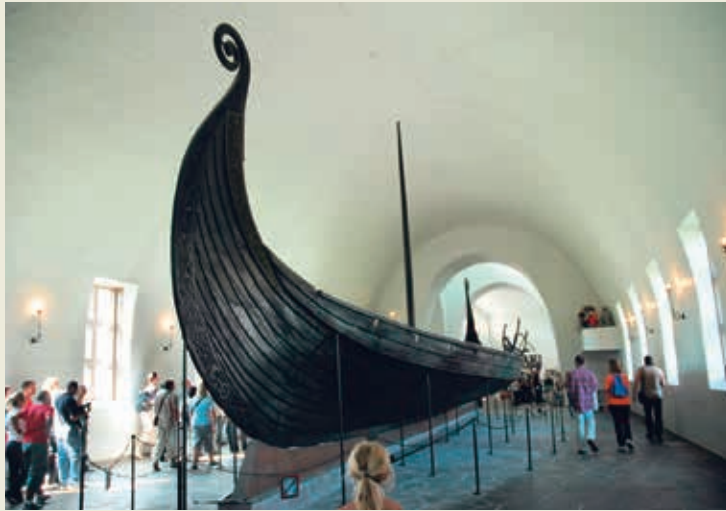
Op diverse plaatsen is het mogelijk Vikingschepen van nabij te bewonderen, zoals het Oseberg-schip in het Vikingskiphus in Oslo.