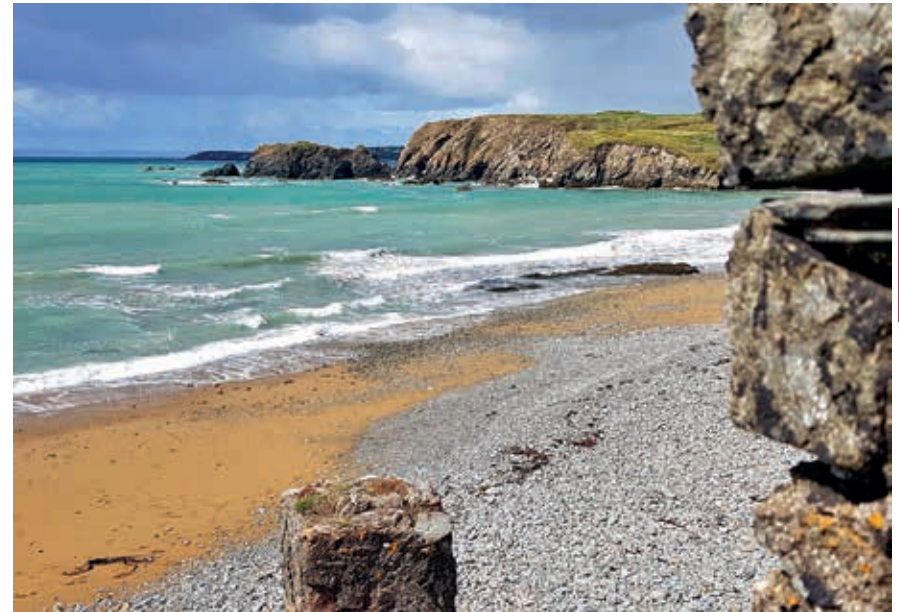
Rotskusten bepalen het beeld rond het gehele eiland.

Karakteristiek voor het groene Ierland zijn de talrijke glooiende weilanden die door muurtjes en hagen van elkaar zijn gescheiden. In die hagen groeien onder meer braam, hulst, meidoorn, kamperfoelie en vlier, terwijl er vooral in het zuiden en zuidwesten ook enorme fuchsiahagen voorkomen, een prachtig gezicht als ze in bloei staan. In en rond de weilanden staan ook verspreide