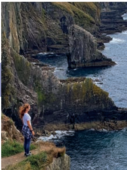
Old Head of Kinsale.