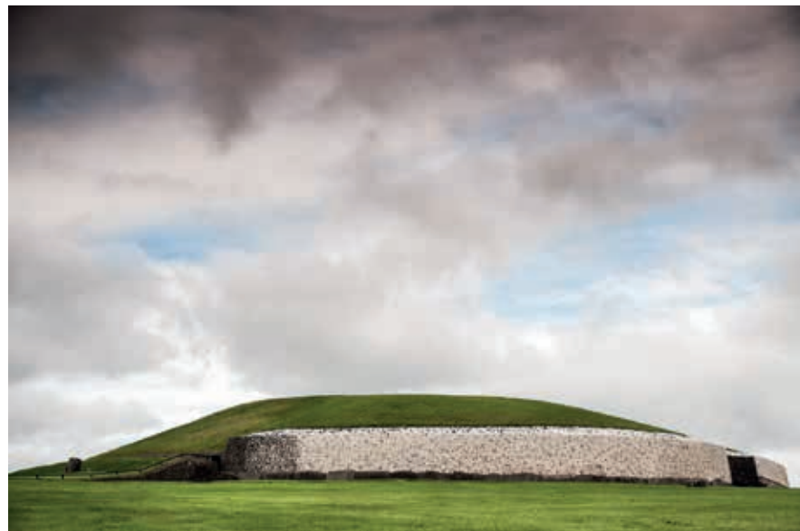
Het ganggraf van Newgrange staat op de UNESCO-werelderfgoedlijst.

Ga je vanuit Dublin via de M1 naar het noorden, dan kun je bij de kust onder Drogheda (de stad op de grens met het graafschap Louth) zeelucht