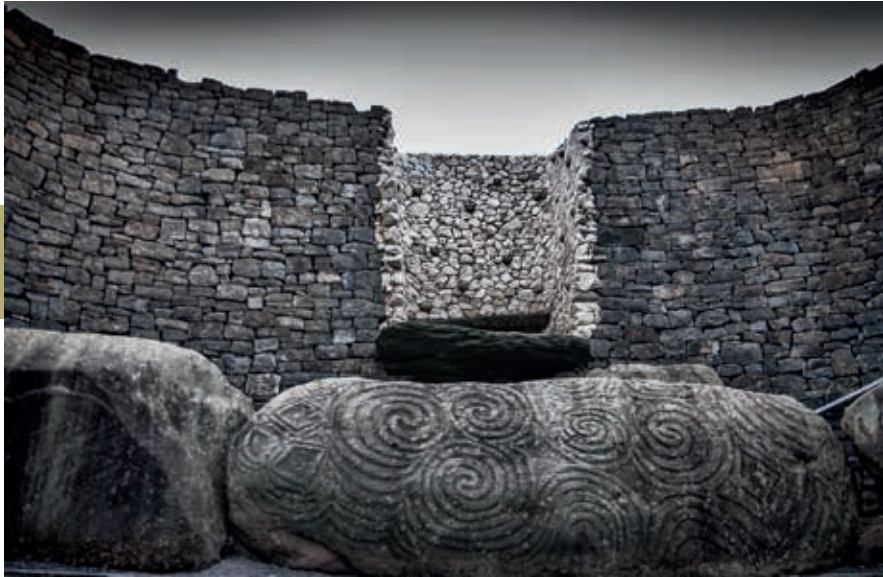
Het befaamde megalithische ganggraf van Newgrange.