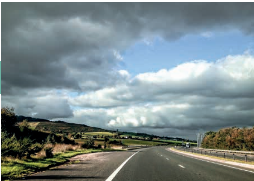
Autoweg ten noorden van Dublin.

Carlingford Lough wordt het decor gevormd door de Mourne Mountains in Noord-Ierland, die tot 850 m komen.