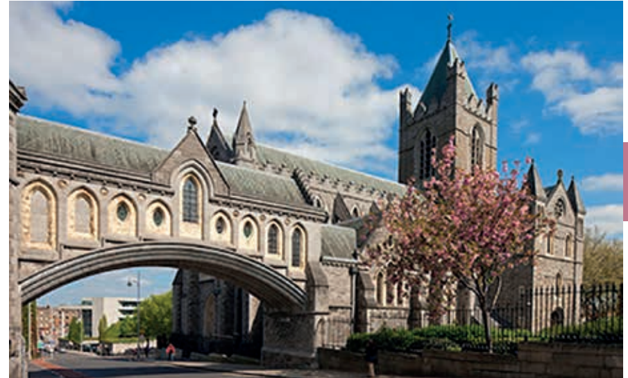
Christ Church Cathedral.

Aan de noordkant van het kasteelcomplex, op de hoek bij Dame Street en Cork Hill, staat de City Hall . Het stadhuis, gereedgekomen in 1779, is met zijn colonades, pilasters en klassieke timpanen een fraai voorbeeld van de Georgian architectuurstijl die in de hoogtijdagen van Dublin in de 18de en 19de eeuw een groot stempel op het aangezicht van de stad heeft gedrukt. Het bezit een fraaie dakkooepel, vooral binnen te appreciëren, en in de gewelven laat de multimediale tentoonstelling Dublin's City Hall: The Story of the Capital zien hoe de geschiedenis en ontwikkeling van Dublin door de eeuwen heen zijn verlopen.