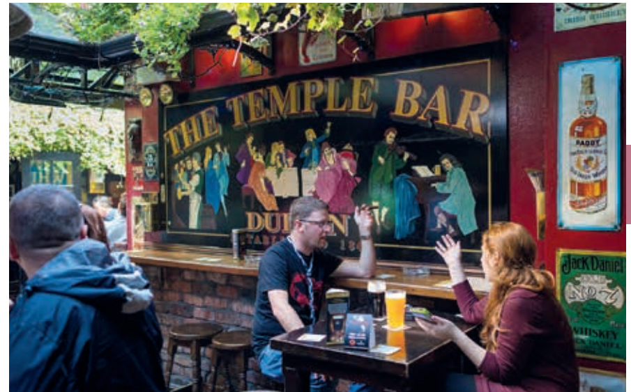
Het terras van de Temple Bar.

Op Meeting House Square, midden in het district, kun je gratis het National Photographic Archive binnen, een afdeling van de nationale bibliotheek van Ierland. Het archief beheert ongeveer 630.000 foto's, een deel is te bezichtigen. Fototentoonstellingen zijn er ook in de Gallery of Photography , aan de overzijde van het pleintje. Op zaterdag is Meeting House