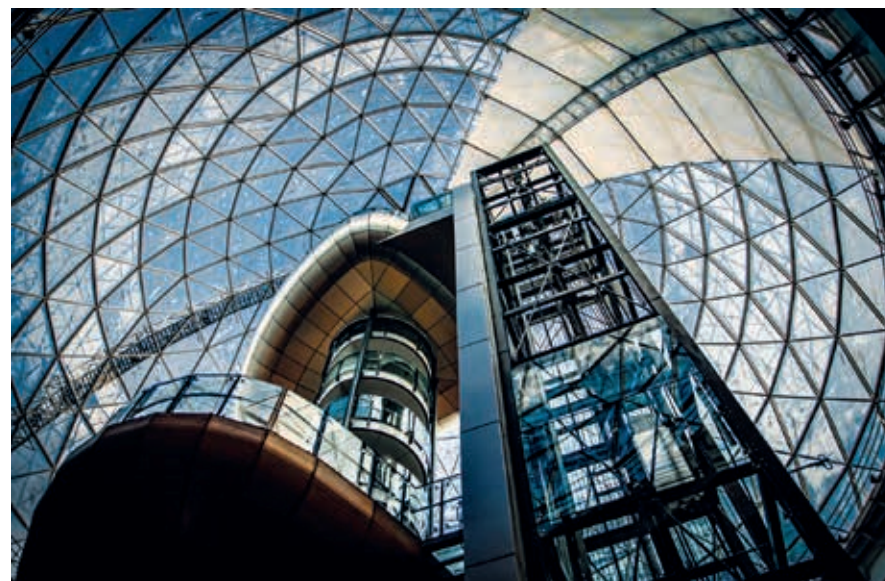
Victoria Square Shopping Centre, spectaculaire koepel.

Belfast is het administratieve centrum van Noord-Ierland; het westelijke deel ligt in het graafschap Antrim, het oostelijke deel in graafschap Down. Hart van de stad is Donegall Square, waar de City Hall staat. Het pompeuze gebouw, in neoclassicistische renaissancestijl, kwam in 1906 gereed, tijdens de hoogtijdagen van Belfast. Op het gras vóór het stadhuis is koningin Victoria vereeuwigd op een sokkel; ze wordt geflankeerd door twee figuren die de linnenindustrie en de scheepsbouw symboliseren en door een kind dat voor onderwijs en toekomst staat. Elders op het terrein staan meer beelden, bijvoorbeeld van Sir Edward James Harland, de oprichter van de beroemde scheepswerven die zijn naam dragen. In de buurt van zijn standbeeld staat een gedenkteken voor de slachtoffers van de Titanic -ramp, en ook kun je allerlei oorlogsmonumenten bekijken rond de City Hall. Bij mooi weer wordt het grasveld trouwens volop benut door inwoners van de stad en toeristen die even uit willen rusten.