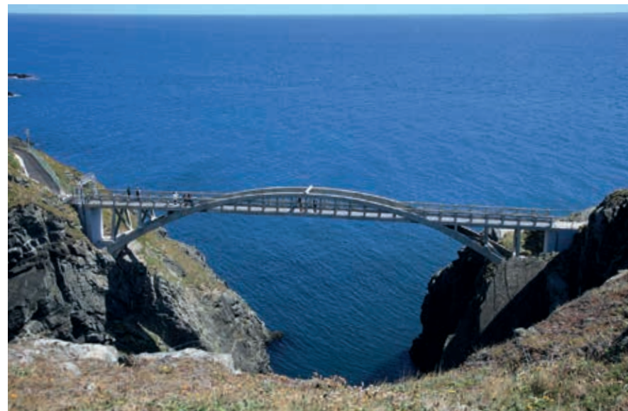
De brug naar Mizen Head.

Ten westen van Clonakilty wordt de Ierse zuidkust steeds grilliger en mooier. Na ongeveer 20 km kom je bij de R597 op een lage heuvel in de groene velden de Drombeg Stone Circle tegen. Rond het begin van onze jaartelling, in de ijzertijd, hebben de Kelten de 16 menhirs van de ceremonieele cirkel hiernaartoe gesjouwd. Vlakbij zijn overblijfselen te zien van twee hutten, een stenen trog en een haard.