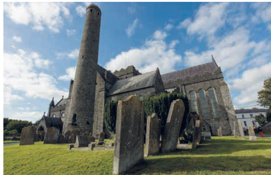
St. Canice's Cathedral & Tower.

Ga je vanaf het kasteel richting stadscentrum, dan kun je rechts naar beneden Rose Inn Street volgen naar de rivier. Aan de linkerkant is het toeristenbureau van Kilkenny gevestigd ( visitkilkenny.ie/contact ). Net vóór de rivier is de voetgangersstraat St. Kieran's Street, links, een aardige