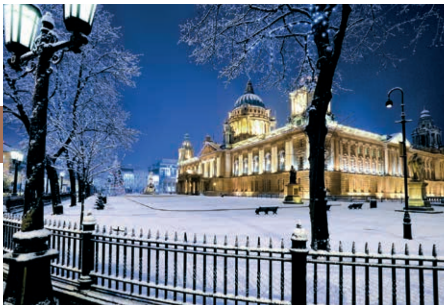
The City Hall in de winter.

nomische crisis trof de stad vanaf 2007 hard. De vastgoedbubbel die was ontstaan spatte uiteen, onroerendgoedprijzen daalden met 30 tot 40% en de werkloosheid steeg weer. Daarna krabbelde de stad weer overeind en kreeg men de opgaande lijn opnieuw te pakken. De stad telt heden ten dage inclusief voorsteden ongeveer een half miljoen inwoners. Trek je de voorsteden eraf, dan blijven er ongeveer 280.000 over.