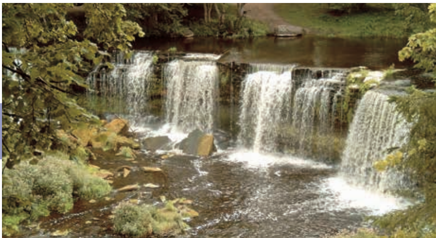
Waterval van Keila-Joa.