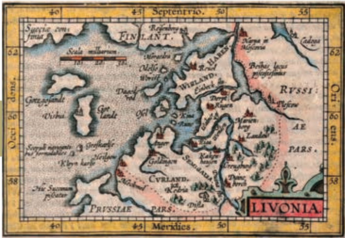
Oude kaart van Lijfland.