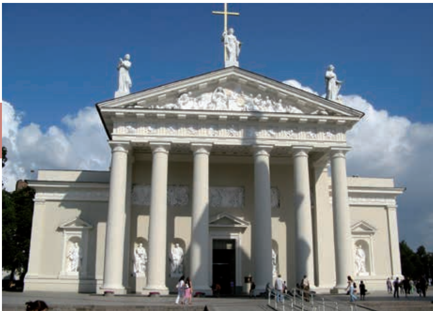
De kathedraal van Vilnius.

eeuwen in Vilnius terecht zijn gekomen, bewijzen het rijke verleden van de stad. Op de bovenste etage is traditioneel houtsnijwerk uit de provincie tentoongesteld.