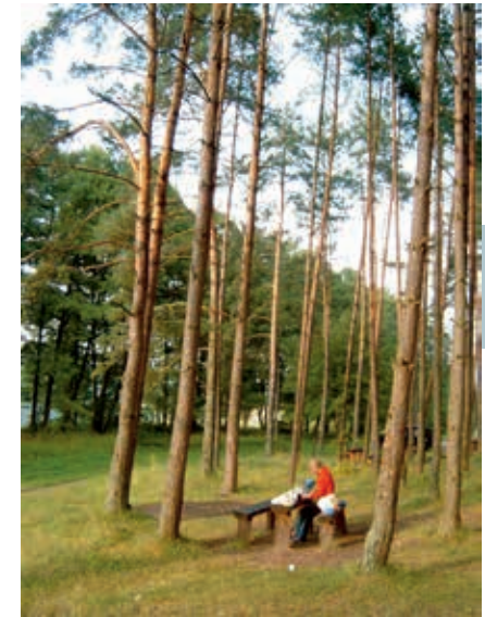
Houten tafels en banken staan klaar om op te koken.

In de meest noordoostelijke hoek van het land, tegen de grens met Letland en Wit-Rusland, staat Litouwens beruchte kerncentrale Ignalina . De reactors zijn enkele jaren geleden gesloten, en dat is maar goed ook: ze waren van dezelfde soort als die in Tsjernobyl. Bovendien was de centrale al jaren over de houdbaarheidsdatum heen. Door regelmatige verbouwingen werd hij met hangen en wurgen draaiende gehouden. Mocht er iets verkeerd zijn gegaan, dan zou een herhaling van 's werelds grootste catastrofe met kernenergie haast onafwendbaar zijn geweest.