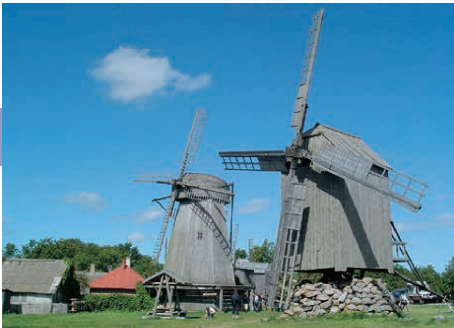
Molens zijn hét symbool van Saaremaa.