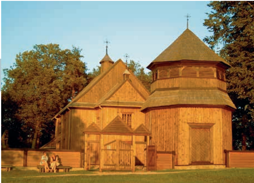
Genieten van de avondzon bij de kerk van Palūšė.

rondom het labyrint aan meren ten noordwesten van Palūšė en is redelijk gemakkelijk te voet of per fiets te doen. Een goede optie is om, startend vanaf de Botanische tuin, eerst 2 km langs het Lūšiameer te gaan naar Meironys. Onderweg passeer je houten sculpturen, gebaseerd op verhalen over de duivel. Meironys zelf is een van de charmantste straatdorpen.