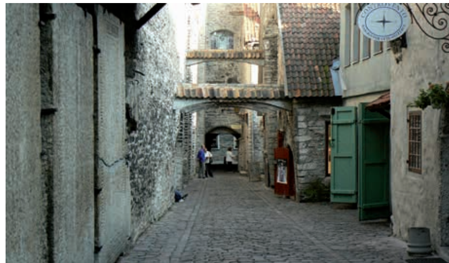
De goed verborgen steeg Katarina käik.

De straat die op de kustpoort aansluit, loopt helemaal door tot aan het stadhuisplein: vandaar dat deze Pikk ('Lang') heet. Hier woonden de rijke kooplieden en zaten de grote gilden. Zo'n beetje de grachtengordel dus en vandaar de schitterende 15de-eeuwse koopmanshuizen. De bovenste etages