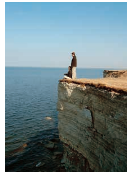
Klif bij Paldiski.

Het Padiseklooster , 15 km ten zuiden van Paldiski over een leuke kronkelweg, is een van de oudste (13de eeuw) en best bewaard gebleven gebouwen uit de regio. Het is gefortificeerd als een kasteel vanwege de boerenopstanden. Zo was het een doelwit tijdens de Sint-Gregoriusnacht van 1343, de laatste en grootste georganiseerde opstand van de lokale bevolking.