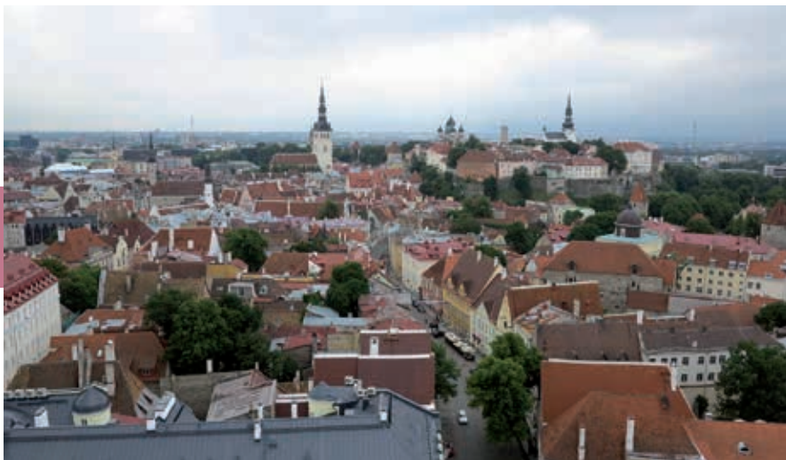
Uitzicht over de oude stad vanaf de Sint-Olafskerk.