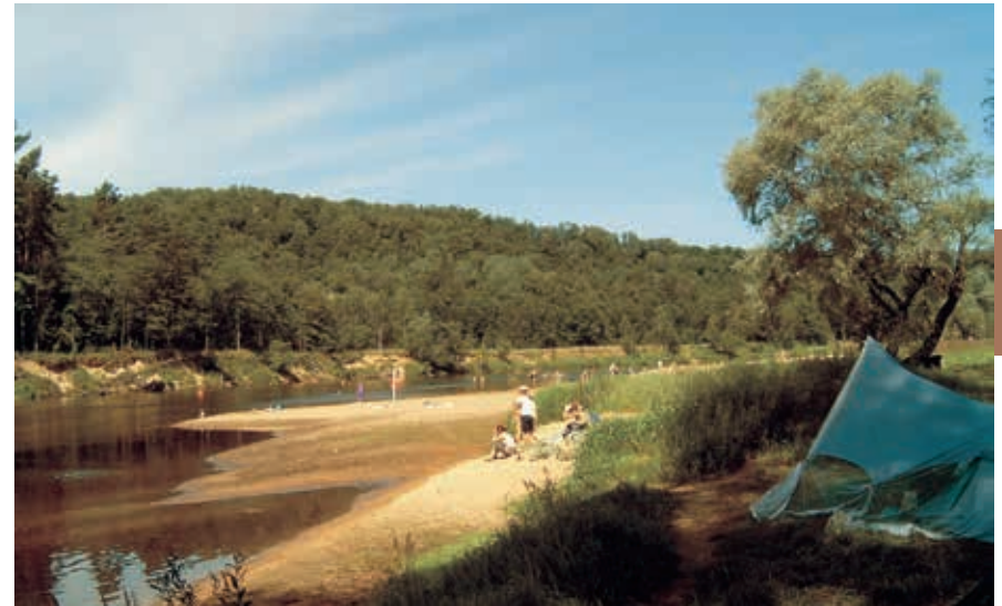
Kamperen aan de Gauja.

Een historische Hanzestad aan de Gauja met kasteelruïnes en een oude kerk (1283): het klinkt goed, maar Valmiera heeft het net niet. Dit komt vooral doordat het historische centrum in 1944 volledig afbrandde. Er is weinig meer te zien, al biedt de kerktoren wel een mooi uitzicht. Valmiera moet het met name hebben van de centrale ligging: kijk nog maar eens op de kaart en je ziet dat alle