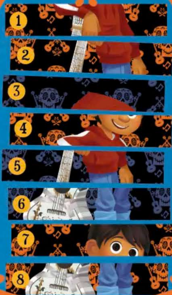
Miguel in het Land van de Levenden

HINT: Kijk goed welke plakjes bij welk land horen. Ze staan allemaal door elkaar.