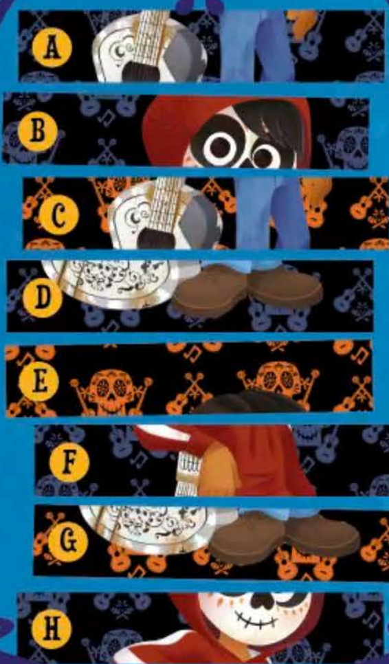
Miguel in het Land van de Doden