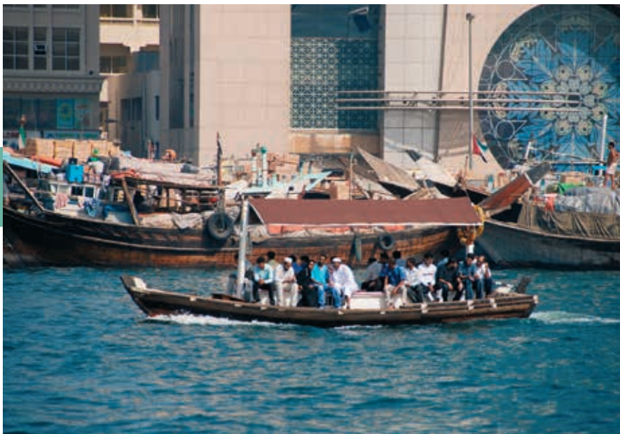
Abra's snellen heen en weer op de kreek van Dubai.

zee; cultuur en traditie; mens en samenleving. De traditionele huizen zijn kleine musea die thematisch ingericht worden en een mooie inkijk geven in de traditionele levensstijl en het rijke culturele erfgoed van deze regio van 1800 tot de jaren 1970. Het ontstaan en de uitbreiding van Dubai (Dubai Creek Museum – Birth of a City) komt aan bod. Er is ook oog voor traditionele sierraden, traditionele gezondheidszorg, schoonheid en versiering, textiel enzovoort. De moderne museale inrichting en nieuwste audiovisuele technieken zorgen voor een mooie beleving. In het bezoekerscentrum kan je een gidsbeurt regelen en vragen naar een plattegrond.