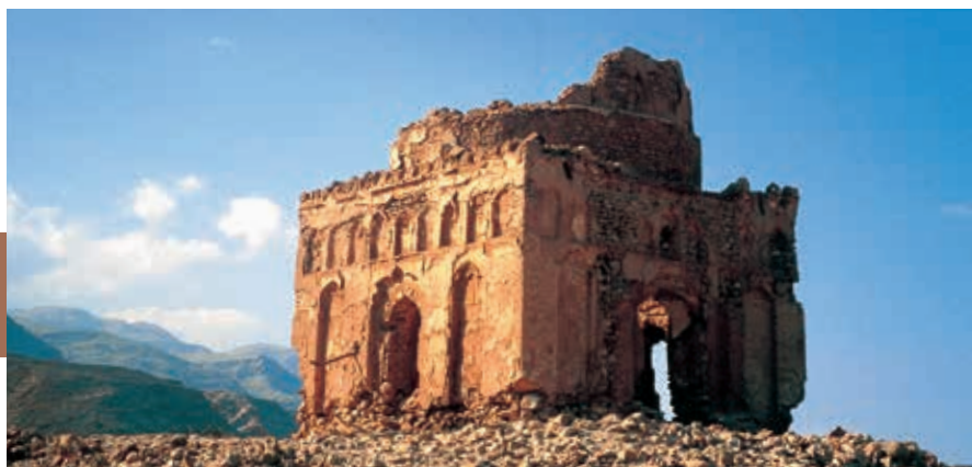
Het mausoleum van Bibi Miriam is het best bewaarde monument uit de bloeiperiode van Qalhat (12de-13de eeuw).

kendste, mooiste en populairste wadi's van het sultanaat is Wadi Shab , nabij het gelijknamige vissersdorpje. De snelweg, een modern stukje wegebouw, hoog boven het dal is misschien wel praktisch, maar ontsiert de eens zo mooie ingang van de fraaie wadi. De prachtige rivierkloof, waar het gehele jaar door water in staat, leent zich uitstekend voor een avontuurlijke tocht. Een bootje (1 RO) brengt je naar de overzijde, waar het pad begint (ca. 60 min.). In de smalle, vruchtbare kloof kun je genieten van de fraaie rotsen, overhangende kliffen en turquoise poelen. Goede schoenen (en watersandalen) zijn geen overbodige luxe. De kloof eindigt in een smalle doorgang waar je alleen wadend en op het einde zwemmend doorheen kunt en die uitkomt in een grot met een waterval. Een waterdichte tas houdt je spullen droog. Neem voldoende drinkwater mee.