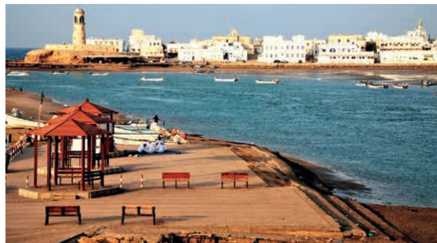
Sur, de belangrijkste stad aan de oostkust van Oman.

Qalhat is de volgende stop. Het is moeilijk voorstelbaar dat dit vissersdorp een belangrijk verleden met zich meedraagt. De historische wortels van het dorpje gaan terug tot de 2de eeuw n.Chr. Vanaf het einde van de 12de eeuw ontpopte Qalhat zich tot een belangrijk zeehandelscentrum, met zijn grootste bloeiperiode een eeuw later, onder de heerschappij van Hormuz. Verhalen van vroegere reizigers, onder wie Marco Polo en Ibn Battuta, weerspiegelen deze welvarende periode. Geschonden door een hevige aardbeving in de 15de eeuw en verwoest door een Portugese inval in 1507 verzonk Qalhat in het niets. Slechts schaarse overblijfselen bleven overeind. Recente