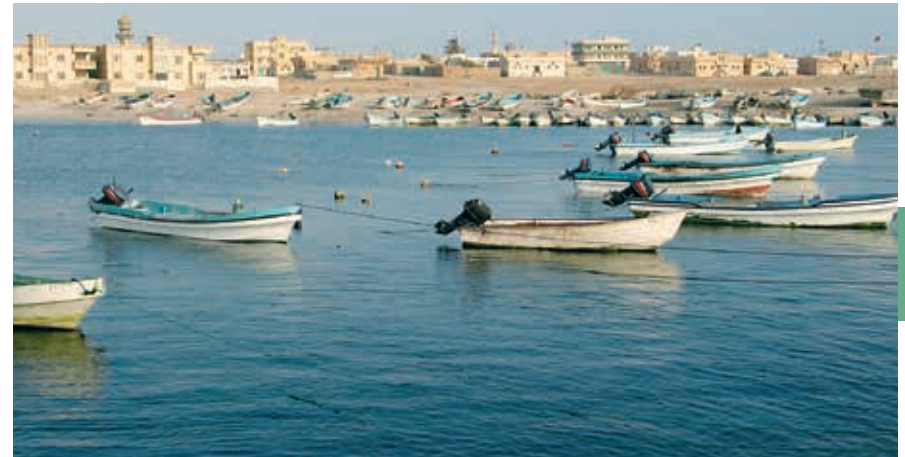
Het vervallen havenplaatsje Mirbat ligt tussen Jebel Samhan en de Arabische Zee.

Langs de hoofdweg Salalah–Mirbat (15 km ten westen van Mirbat) loopt een steile weg linksaf de bergen in, richting Tawi Attair. De bijnaam van