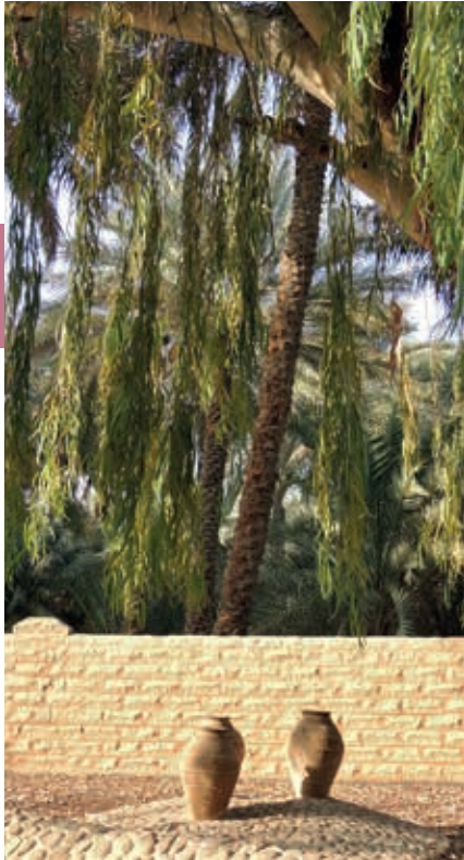
De schaduwrijke dadelpalmoase in Al-Ain.

Anantara organiseert safari's in het Arabian Wildlife Park. Dit voormalige koninklijke natuurpark (87 km 2 ) met vogelreservaat was een persoonlijk project voor natuurbehoud van Sjeik Zayed bin Sultan Al Nahyan. Het beslaat de helft van het eiland en je kan er Arabische oryxen, gazellen, giraffen, hyena's en cheeta's spotten.