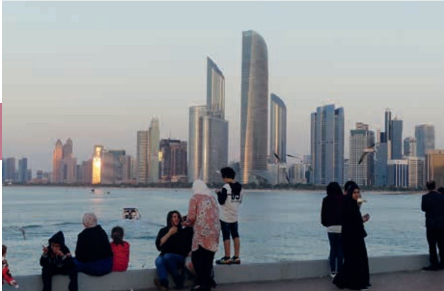
De zachte gloed van de ondergaande zon kleurt de Corniche van Abu Dhabi oranje-rood.

standen in de stad zijn bedrieglijk, want veel groter dan verwacht. Voor een stadsbezoek kun je, wanneer je niet over eigen vervoer beschikt, het beste een taxi of een stadsbus nemen.