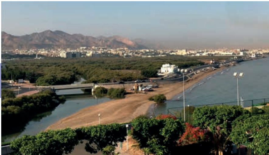
Uitzicht over de residentiële wijk Qurum en het natuureservaat Qurum Nature Reserve.