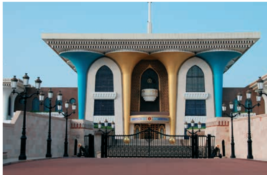
Qasr al-Alam, het paleis van sultan Haitham aan de baai in Muscat.

In de 17de en 18de eeuw evolueerde Oman tot een welvarende maritieme mogendheid, die een groot deel van de Oost-Afrikaanse kust controleerde. Aan het begin van de 18de eeuw brak er een burgeroorlog uit en lieten de Perzen hun invloed gelden. Zij werden verjaagd door Ahmed bin Said Al