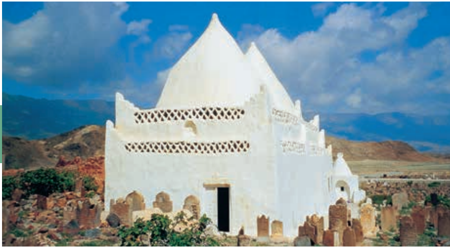
Het mausoleum van de 12de-eeuwse kluizenaar Sjeik Mohammed bin Ali al-Alawi is gebouwd in Zuid-Jemenitische stijl.

nabij gelegen haven Al-Balid aan belang. Samhuram staat op de UNESCO-werelderfgoedlijst.