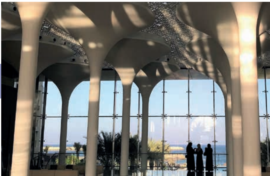
Het Qasr al-Alam paleis diende als inspiratiebron voor het nieuwe Kempinski Hotel in Muscat.